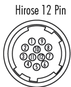
Hirose 12 Pin