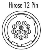
Hirose 12 Pin